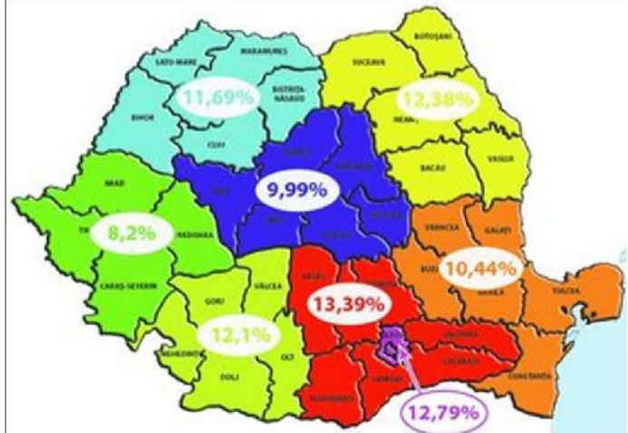
PREDATORR, Prevalențe diabet